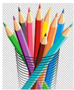
Los lápices de colores