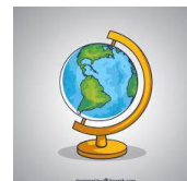
El globo/ la esfera