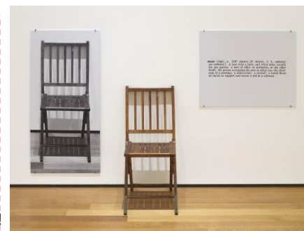
● JOSEPH KOSUTH, One and three chairs 1965

Expliques pourquoi Clique sur l'image pour en savoir plus !