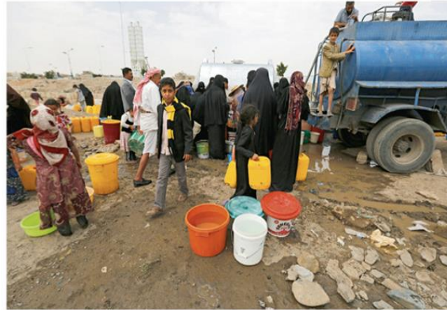
a. Enfants devant une citerne d'eau à Sanaa, Yémen, 2014.