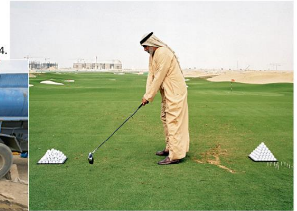
b. Un parcours de golf à Riyadh en Arabie Saoudite, 2014. Les Émirats arabes unis comptent aujourd'hui une vingtaine de golfs arrosés, certains de renommée mondiale, dans un pays en grande partie désertique.