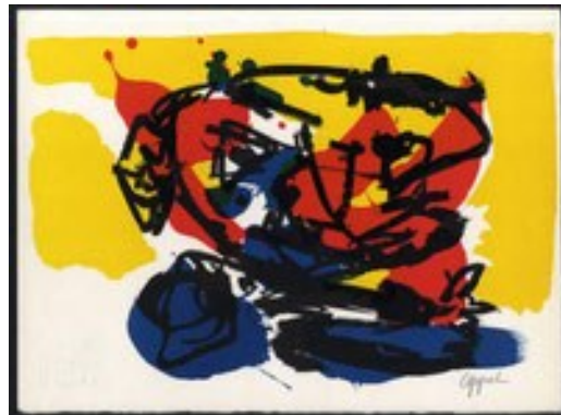
Karel Appel , Sans titre, 1960

Abstraction : c'est lorsqu'une œuvre ne représente pas directement la réalité. Elle est composée de formes, de couleurs, de matériaux divers disposés sur un support mais on ne peut pas identifier clairement une chose ou une personne. Chacun peut comprendre l'œuvre à sa manière !