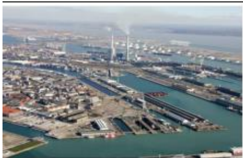
Port du Havre

EXERCICE 1 : Ceci est un exercice déjà vu en classe. Observe les documents et réponds aux questions.