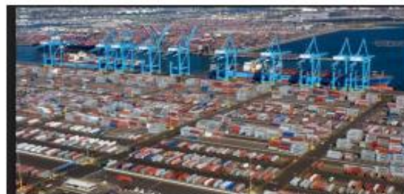
Port de Los Angeles