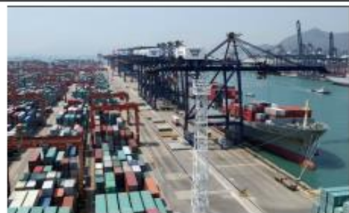
Port de Hong -Kong