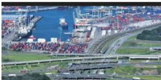
Port de Rotterdam