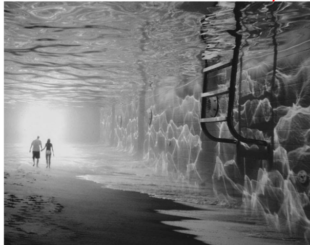
John Barbey , oh sheet ! et Sunbathing

Photomontage : assemblage de plusieurs photographies pour créer un tout cohérent et novateur.