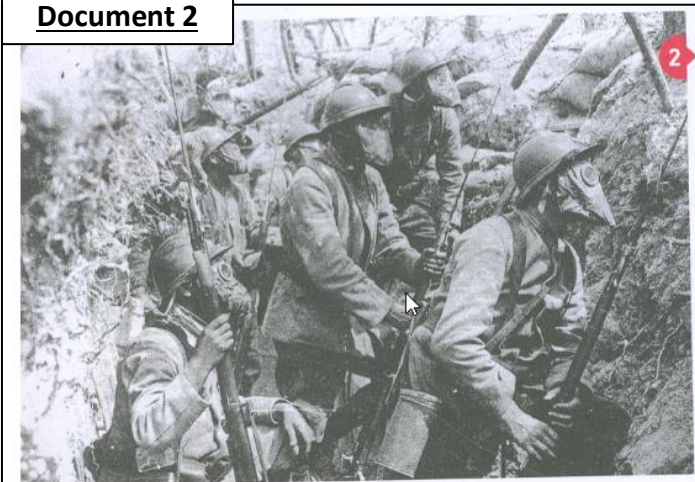
2 Une sortie de tranchée : soldats français en 1915