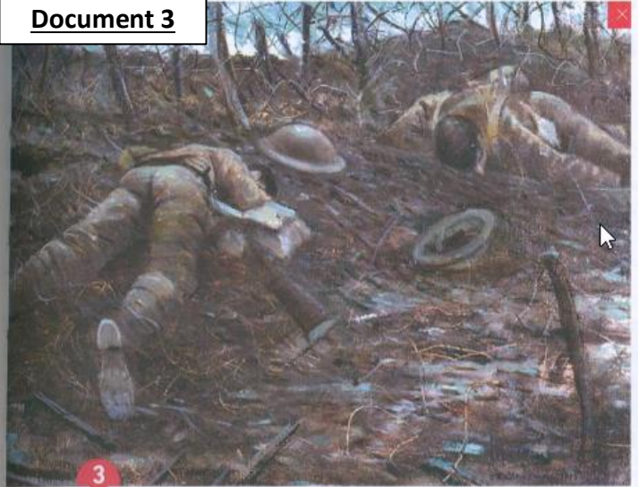
3 Les Chemins de la gloire (Paths of Glory).

Huile sur toile de C. R. W. Nevinson, 1917. 45,7 x 60,9 m. Londres, Imperial War Museum.